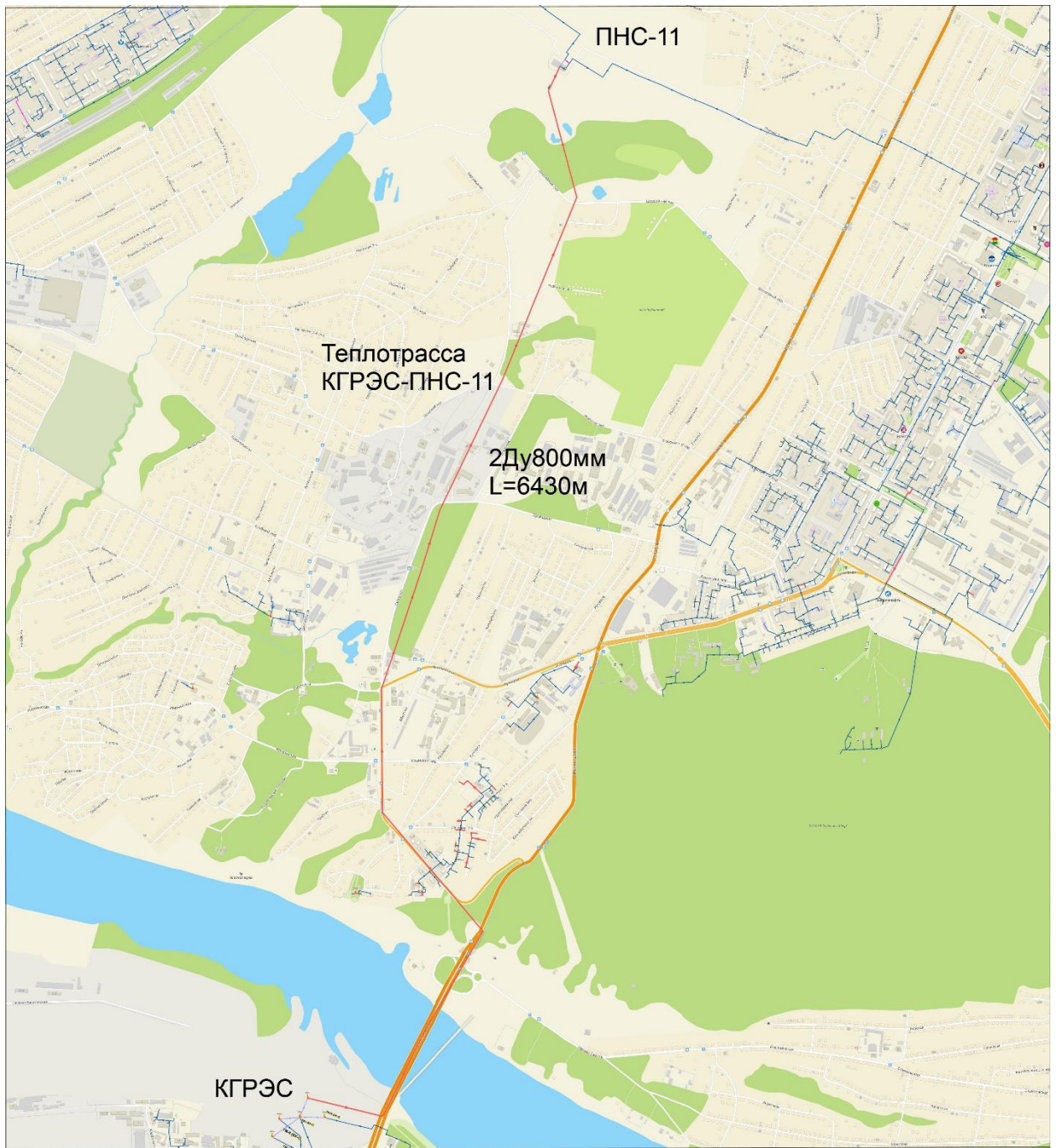
Рисунок 7-1 – Схема прокладки теплотрассы от Кемеровской ГРЭС до ПНС-11 (2Ду800, 6100м)