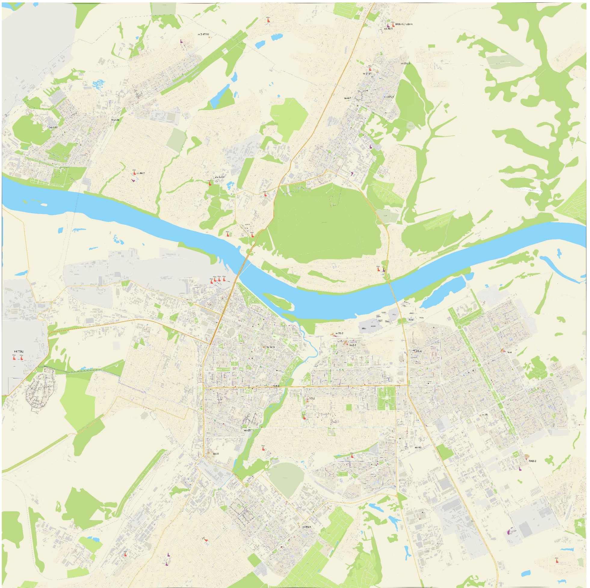
Рисунок 6-2 – Схема тепловых сетей г. Кемерово с учетом перспективной договорной тепловой нагрузкой (на 2033 г.) и скоростью движения теплоносителя меньше 0,3 м/с (тепловые сети выделены красным цветом)