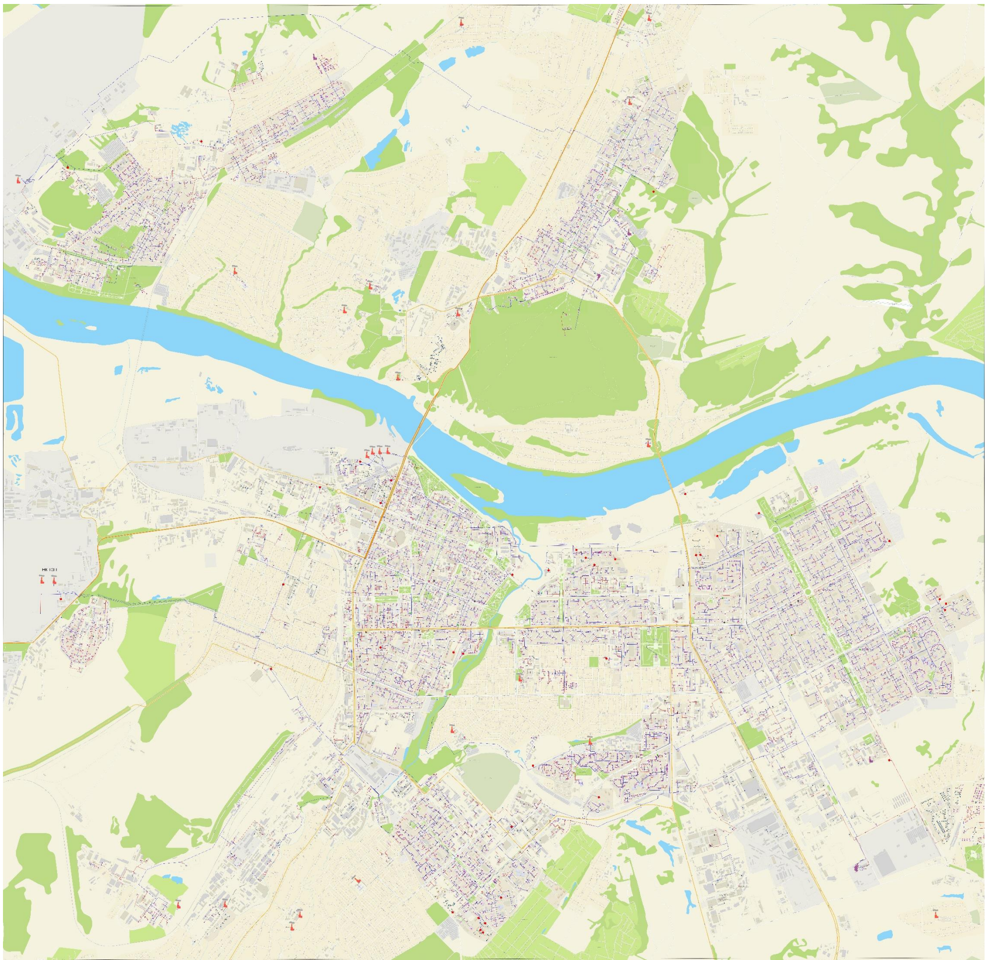
Рисунок 6-1 – Схема тепловых сетей г. Кемерово при расчетной тепловой нагрузке (на 2020 г.) и скоростью движения теплоносителя меньше 0,3 м/с (тепловые сети выделены красным цветом)