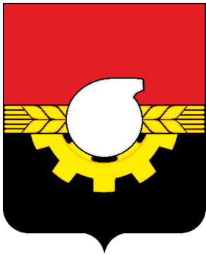
СХЕМА ТЕПЛОСНАБЖЕНИЯ ГОРОДА КЕМЕРОВО ДО 2033 ГОДА (АКТУАЛИЗАЦИЯ НА 2021 ГОД)