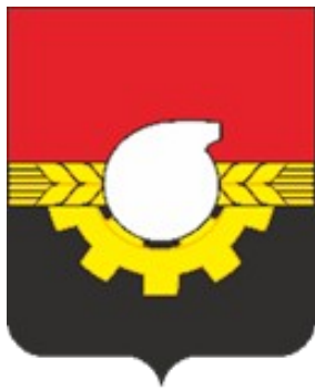
СХЕМА ТЕПЛОСНАБЖЕНИЯ ГОРОДА КЕМЕРОВО ДО 2033 ГОДА (АКТУАЛИЗАЦИЯ НА 2021 ГОД)