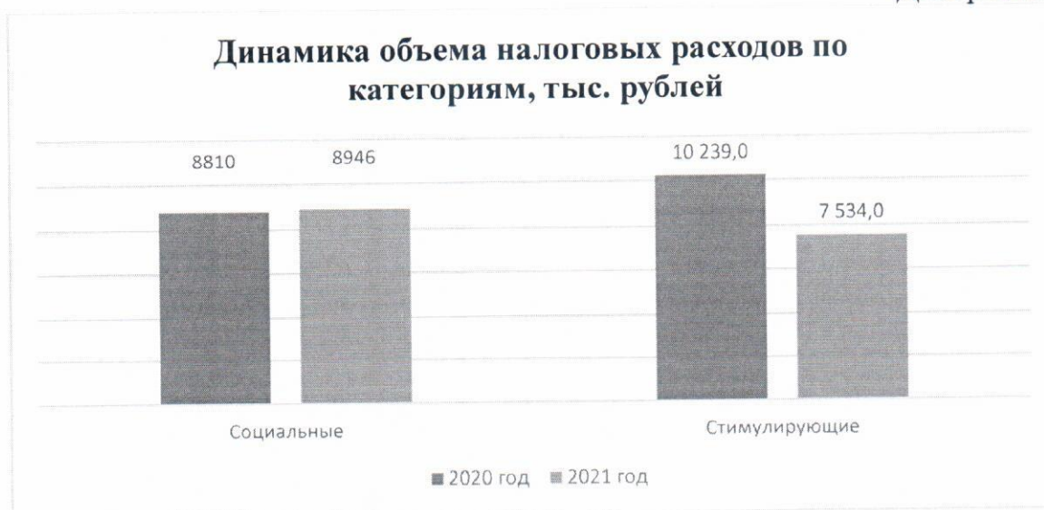
Диаграмма № 1

В 2021 году объем социальных налоговых расходов к уровню 2020 года увеличился на 136,0 тыс. рублей или на 1,5%, стимулирующие налоговые льготы уменьшились на 2 705,0 тыс. рублей или на 26,4%.